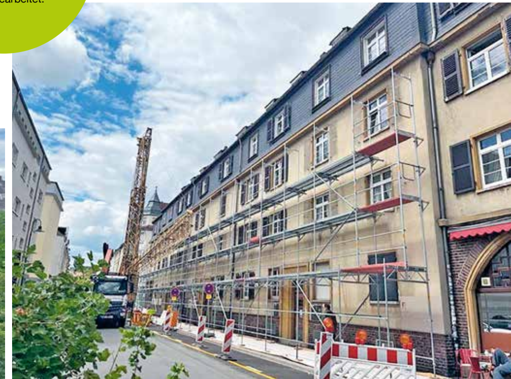
Das Gerüst steht: Bis Ende 2025 wird im Bellevueblock mit Hochdruck gearbeitet.