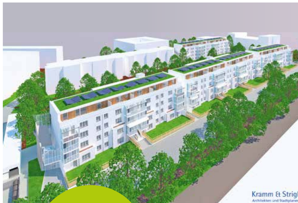
Der Architektenentwurf stammt von „Kramm & Strigl Architekten und Stadtplaner“ und fügt sich harmonisch in das Straßenbild ein.

Die vier Häuser werden nacheinander modernisiert, über den genauen zeitlichen Ablauf werden Mieterinnen und Mieter fortlaufend informiert. Neun der 20 neuen Wohnungen sind öffentlich gefördert. Die Arbeiten am gesamten Projekt sollen Mitte 2026 abgeschlossen sein. ■